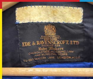
Contoh Jubah yang dibuat di London

Sejarah jubah konvokesyen Universiti Kebangsaan Malaysia (UKM) bermula dengan penuh simbolik pada 23 Jun 1973, apabila Istiadat Konvokesyen pertama universiti ini dilangsungkan di Bangunan Parlimen. Dalam istiadat ini, Tun Abdul Razak bin Dato' Hussein diistiharkan sebagai Canselor pertama UKM. Istiadat ini turut menampilkan pemakaian pakaian konvokesyen pertama UKM.