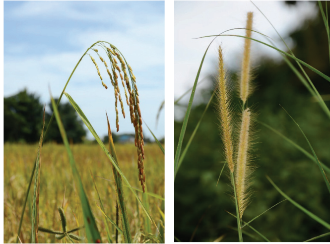
Foto 1 Padi ( Oryza sativa ) dan lalang ( Imperata cylindrical ).