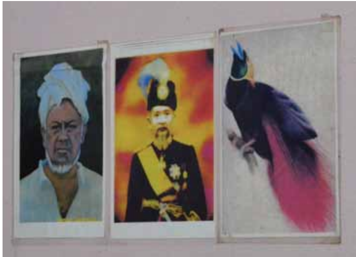
Rajah 1 Gambar Tok Kenali, Sultan Abdul Hamid Shah, Sultan Kedah ke-26 (1882-1943) dan burung cenderawasih.