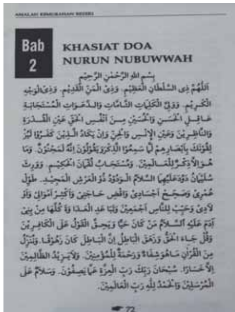
Rajah 4 Gambar foto doa murah rezeki.