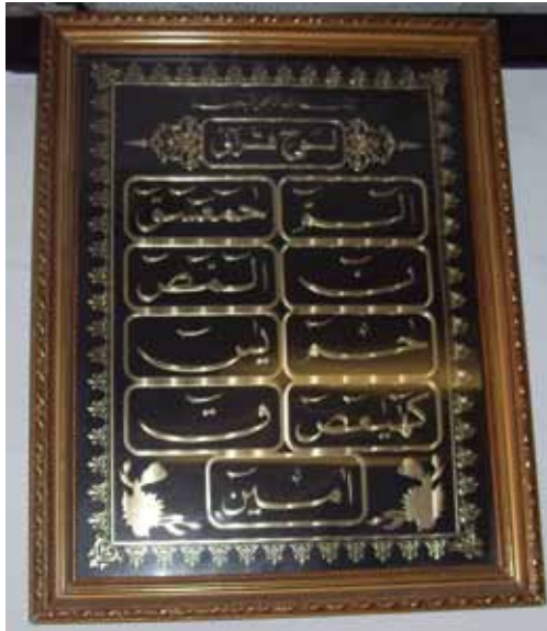
Rajah 3 Gantungan gambar kombinasi ayat al-muqattaat .