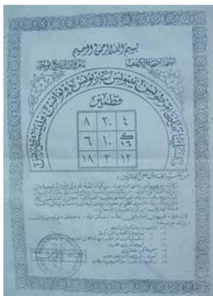
Rajah 5 Gambar foto wafak di sebuah kedai gunting rambut di Kepala Batas, Seberang Perai Utara, Pulau Pinang.

Wafak pelaris diambil gambar fotonya pada 12 Oktober 2012 di sebuah kedai gunting rambut di Paya Keladi, Kepala Batas, Seberang Perai Utara, Pulau Pinang. Pemilik kedainya, iaitu peniaga C memberitahu pengkaji bahawa, beliau mendapat