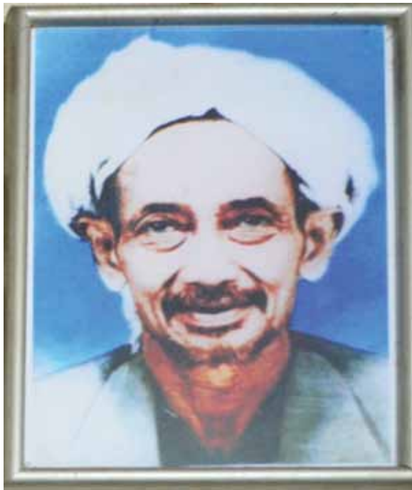
Rajah 2 Gambar Sheikh Abdullah Fahim.