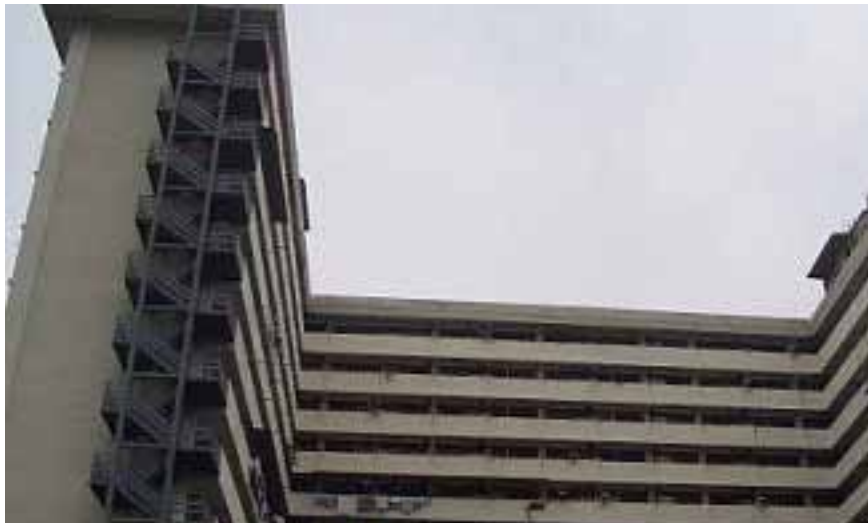
Rajah 1 Rumah pangsa 17 tingkat di Kampung Kerinchi, Kuala Lumpur.

Rumah pangsa 17 tingkat yang terletak di Kampung Kerinchi, Kuala Lumpur telah dipilih sebagai tempat kajian. Data berdasarkan soal selidik dan temu bual terhadap 47 buah keluarga Melayu berpendapatan rendah yang menetap di rumah pangsa tersebut. Kesemua responden merupakan masyarakat Melayu yang beragama Islam yang terdiri daripada guru, kerani, peniaga kecil, pemandu teksi, pekerja kilang dan buruh kasar.