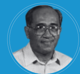
Dr. Syed Husin Ali Ahli Jawatankuasa Kecil Konsep & Ilmiah