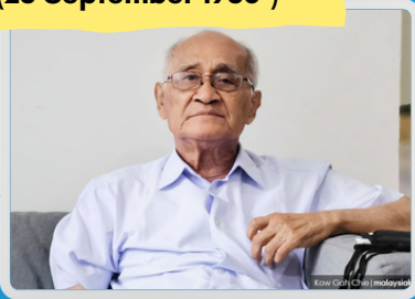
Dr. Syed Husin Ali (23 September 1936-)