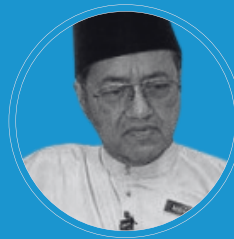
Tun Dr. Mahathir Mohamed Timbalan Pengerusi