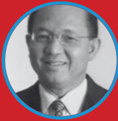
Tan Sri Azman Hashim Ahli Jawatankuasa Kecil Kewangan