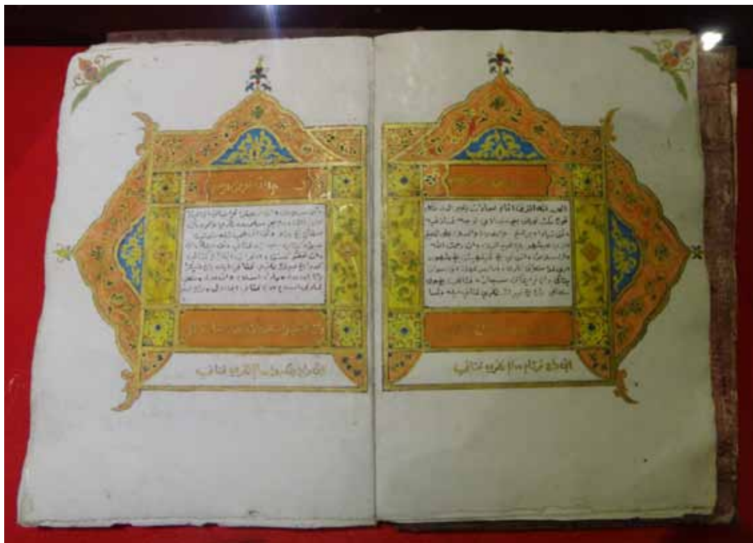
Rajah 1 Sejarah Petani (MS809), Pusat Manuskrip Melayu, Kuala Lumpur.