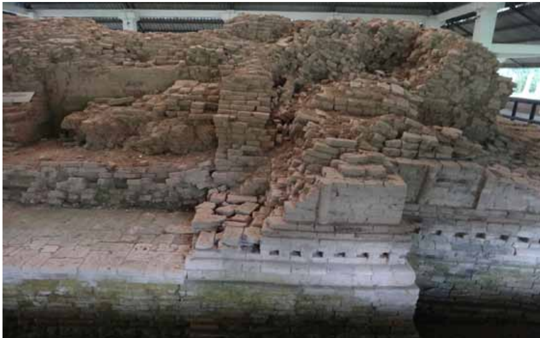
Rajah 2 Kesan runtuhan purba di Yarang, Patani.